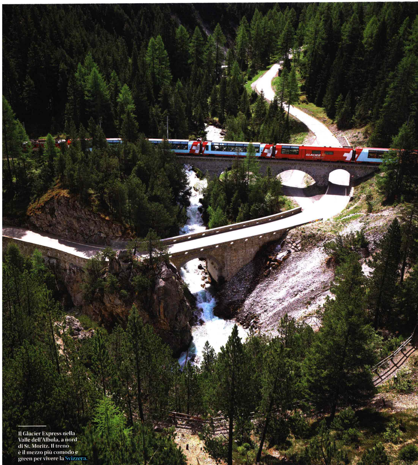
Il Glacier Express nella Valle dell'Albula, a nord di St. Moritz. Il treno è il mezzo più comodo e green per vivere la Svizzera.