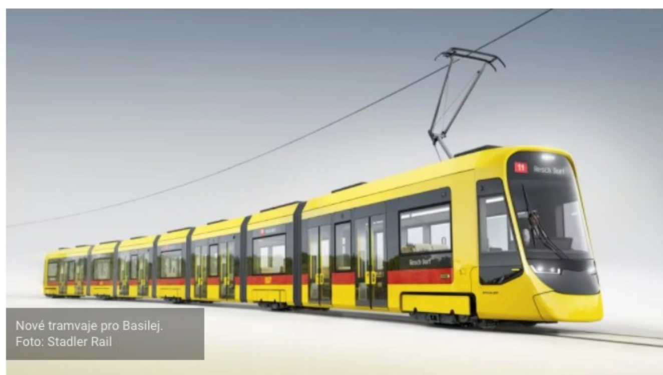
Nové tramvaje pro Basilej.

Nové tramvaje nahradí nejstarší čtyřicet let staré soupravy v provozu.