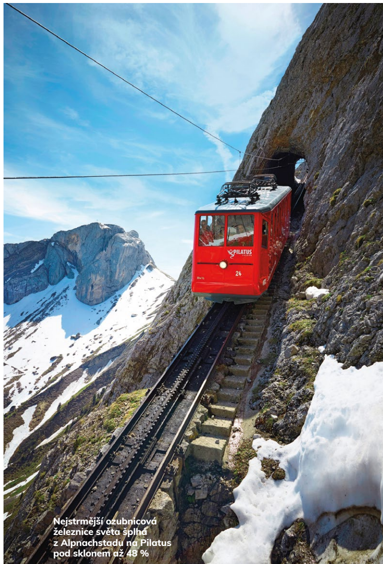
Nejstrmější ozubnicová železnice světa šplhá z Alpnachstadu na Pilatus pod sklonem až 48 %