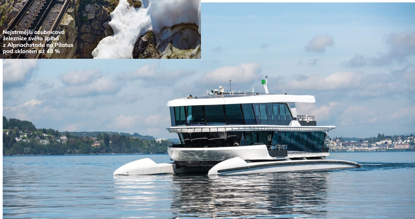
Futuristický katamaran pendluje každou hodinu na lince Lucern – Bürgenstock