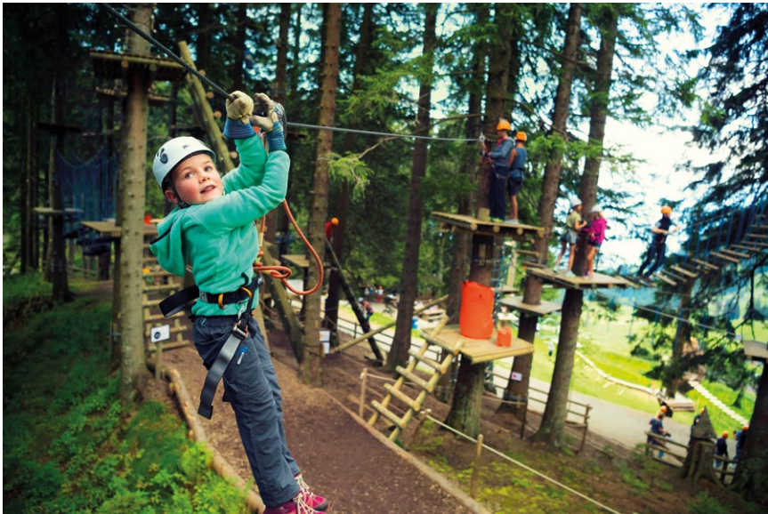
Adrenalin na Dračí skále přináší lanový park v mezistanici pilatusovské lanovky Fräkmüntegg, mají tu zabezpečené lanové cesty pro děti už od 4 let