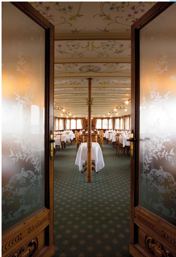
Secesní luxus je na palubách parníků všudypřítomný