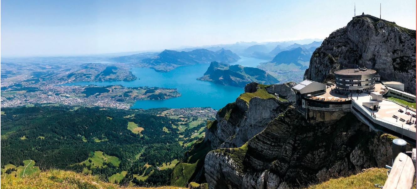
Jeden z nejkrásnějších výhledů na jezero je z vrcholu dvoutisícové hory Pilatus nad Lucernem