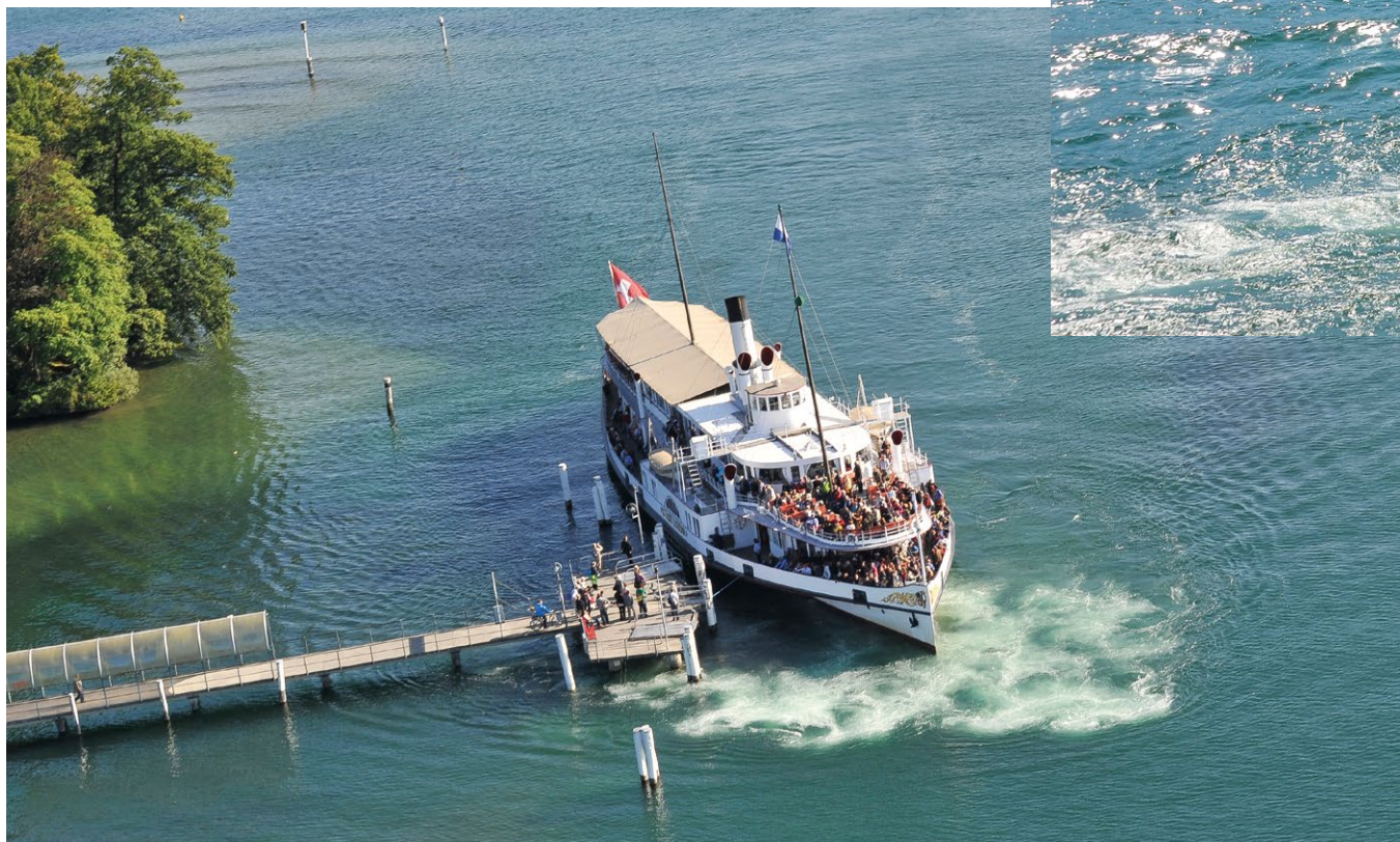
Stadt Luzern: ikonická loď lucernské flotily vyplouvá letos na jaře z městských loděnic po totální renovaci