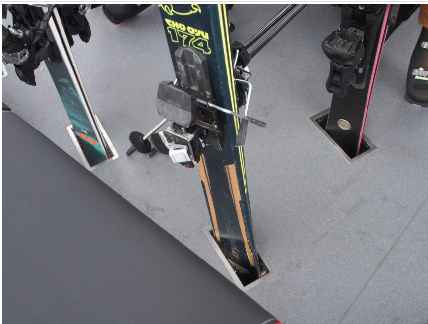
スキーを立てる場所は Gondola 内。

3本のワイヤーを使い安定性が向上した最新のシステムを利用し、風に強く揺れが少ない26人乗り。実際に強風の日に乗ってみると高い安定感を感じた。