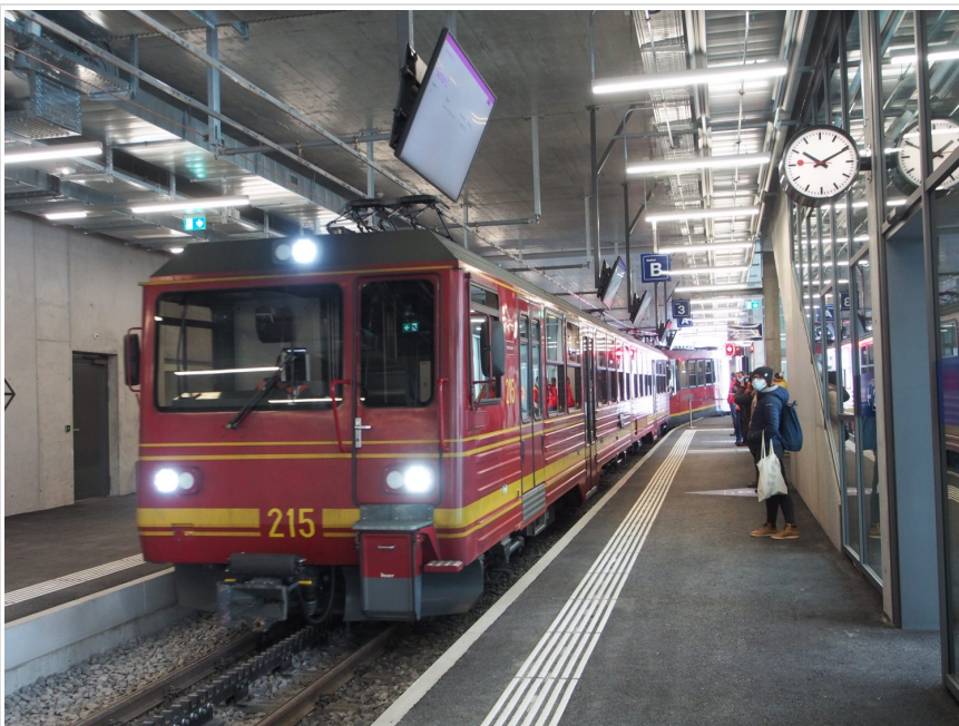
新しく増設されたホーム。

ゲートの緑は予約あり、黄色は予約なし、紫が10名以上のグループとなる。繁忙期は個人でも予約することをおすすめする。