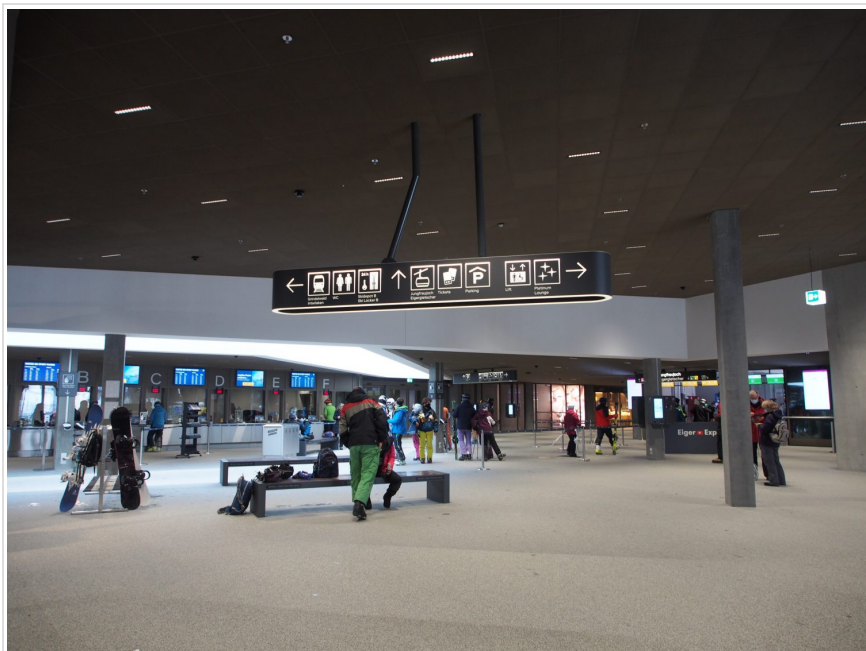
左手がチケットカウンター。右手奥が乗り場。

空港のように開放的なターミナル駅。お土産物、スポーツショップやレンタル、カフェ、スイスチョコレートやリンツ、スーパーマーケットなどのお店があり、ここに来るだけでも楽しめる場所である。