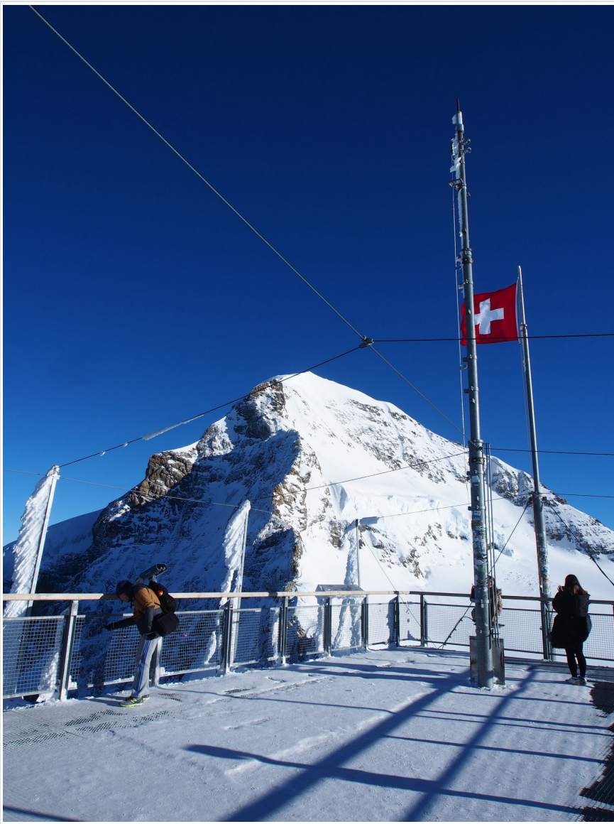
スフィンクス展望台とメンヒ。