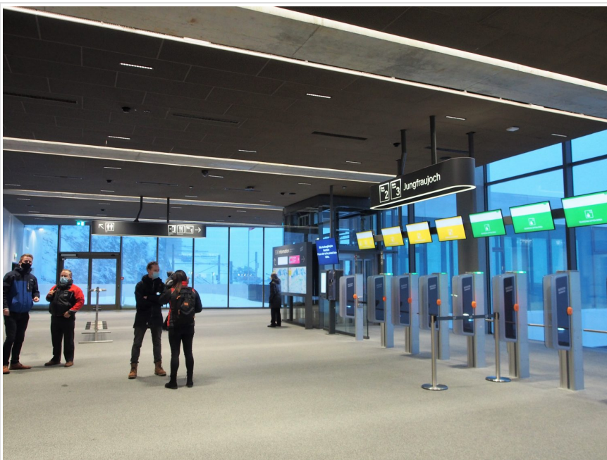
右のゲートを通してユングフラウヨッホへ。

1912年に全線開通したユングフラウ鉄道に乗り換え、ユングフラウヨッホ駅を目指す。