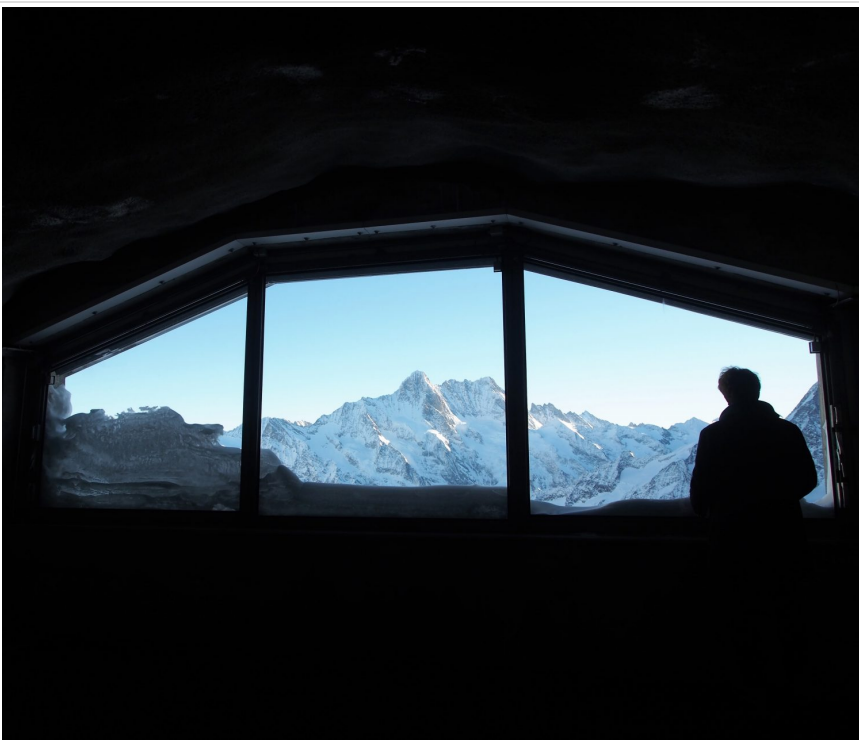
アイスメア駅からの絶景。

トンネル内の途中駅3160mのアイスメア駅からはシュレックホルンの絶景が広がる。