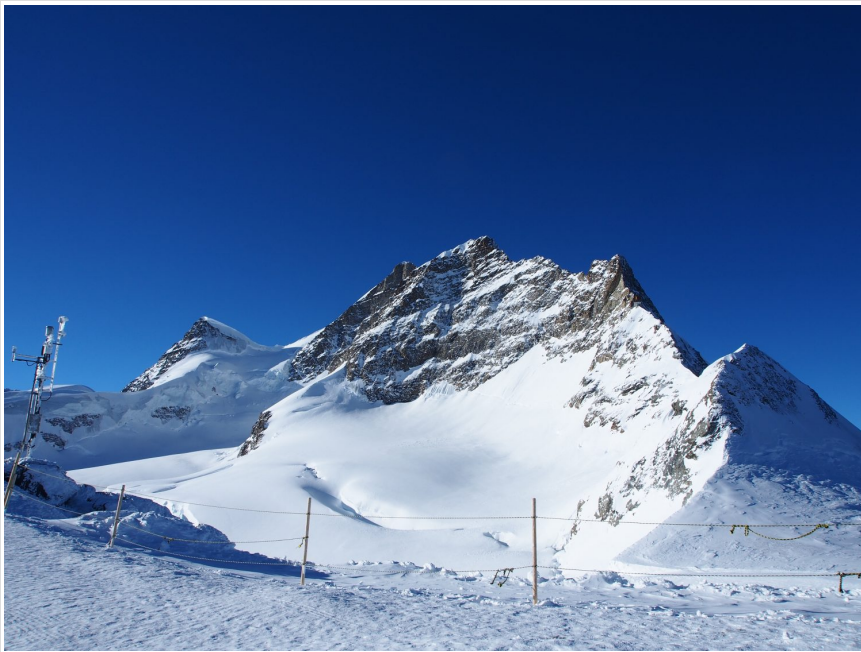
プラトーから眺めるユングフラウ。

20m下に作られた神秘的な氷河の中につくられた氷の宮殿・アイスパレス。常にマイナス2度を保っているので、防寒が必要だ。