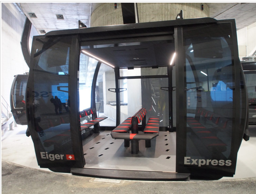
椅子のシートは温かくなるシステム。寒い日はありがたい。

3本のワイヤーを使い安定性が向上した最新のシステムを利用し、風に強く揺れが少ない26人乗り。実際に強風の日に乗ってみると高い安定感を感じた。