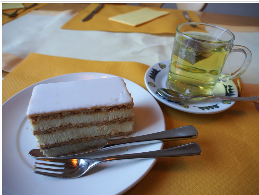
ボリュームたっぷり。

筆者がいつもここで食べるのがクレームシュニッテ。たっぷりのクリームとサクサクのミルフィーユが絶品。こってり濃厚なのでハーブティーをチョイスすべし。