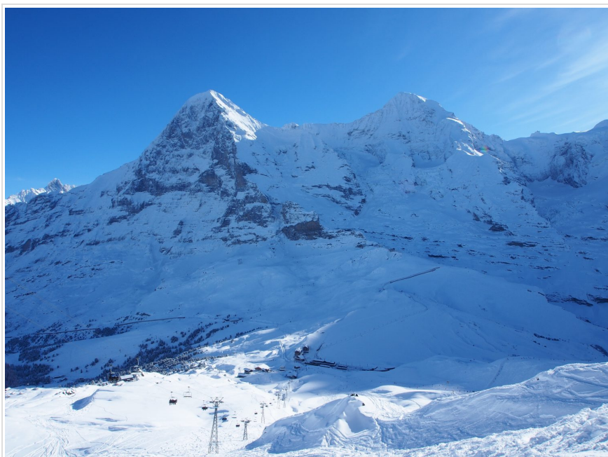
スキーエリアからアイガー北壁とメンヒを望む。

筆者がいつもここで食べるのがクレームシュニッテ。たっぷりのクリームとサクサクのミルフィーユが絶品。こってり濃厚なのでハーブティーをチョイスすべし。