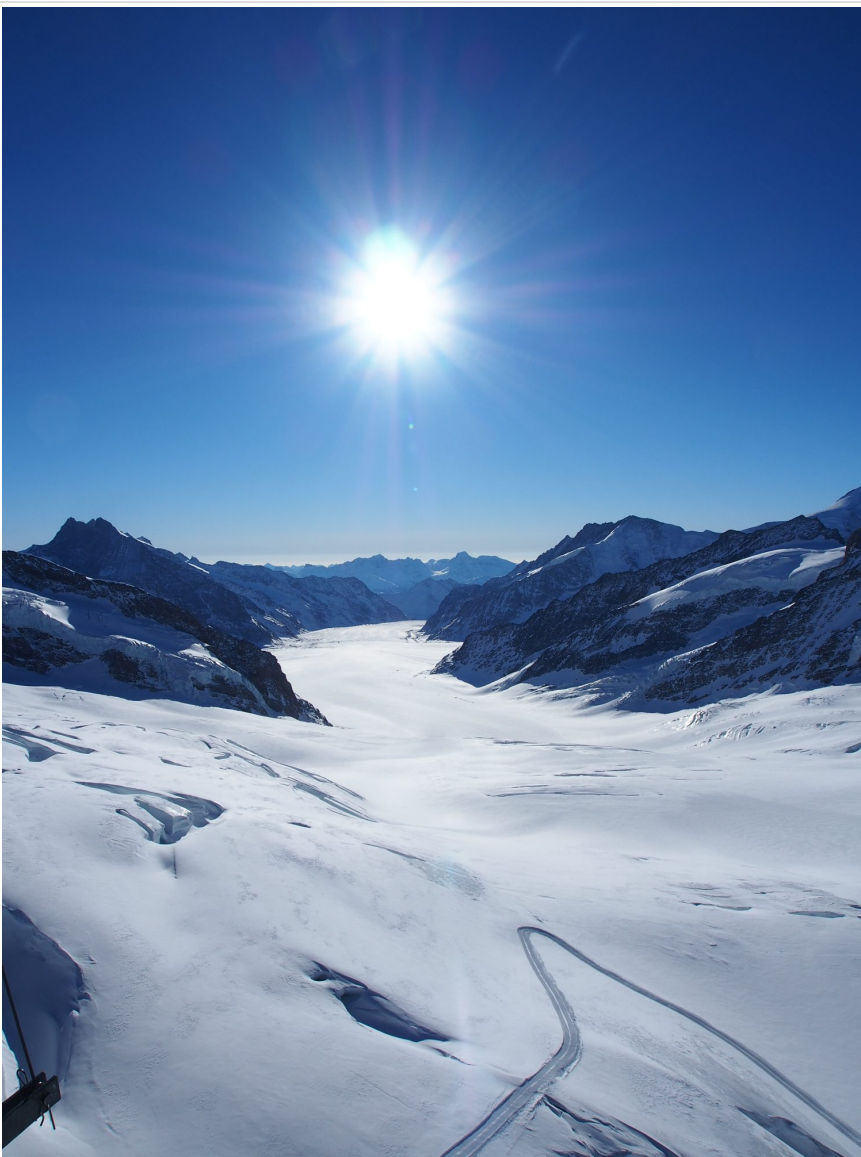
スフィンクス展望台から見るアレッチ氷河。

全長約24km、アルプス最大・最長の氷河。コンコルディアプラッツという4つの氷河が合流するポイントは深さが900mとも言われている。